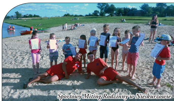
Sportowy Miting Rodzinny w Nieskurzowie