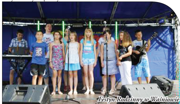
Festyn Rodzinny w Waśniowie

14 lipca w Waśniowie na festynie rodzinnym oficjalnie powitano lato. Błonie zgromadziły liczne tłumy zarówno z całej gminy jak i z sąsiadujących z nią. W programie wystąpili uczestnicy IX Gminnych Prezentacji Artystycznych oraz zespoły wokalne – instrumentalny i zespół taneczny Gminnego Ośrodka Kultury i Sportu. Nie obyło się bez licznych konkursów i atrakcji dla najmłodszych jak również pokazy sztuk walk – mistrzowie karate, jujitsu, krav maga, zawody na Mobilnej Ścianie Wspinaczkowej. Wieczorem na scenie pojawił się zespół Pudzian Band, który bawił całą publiczność. Na zakończenie festynu dla starszych rozpoczęła się dyskoteka pod gołym niebem. Jednak nie był to koniec atrakcji, ponieważ imprezę zakończył występ zespołu Effect. Jak co roku festyn cieszył się dużym zainteresowaniem.