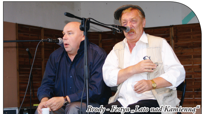
Brody - Festyn „Lato nad Kamienną”

Gorące rytmy cygańskiego zespołu „Romen” podrywał publiczność do pierwszych tego dnia tańców. Zespół „Toffi Band” grając znane przeboje muzyki pop podrzymał nastrój zabawy, która trwała do późnego wieczora. Festyn zakończył się pokazem sztucznych ogni.