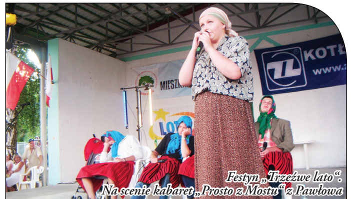
Festyn „Trzeźwe lato”. Na scenie kabaret „Prosto z Mostu” z Pawłowa