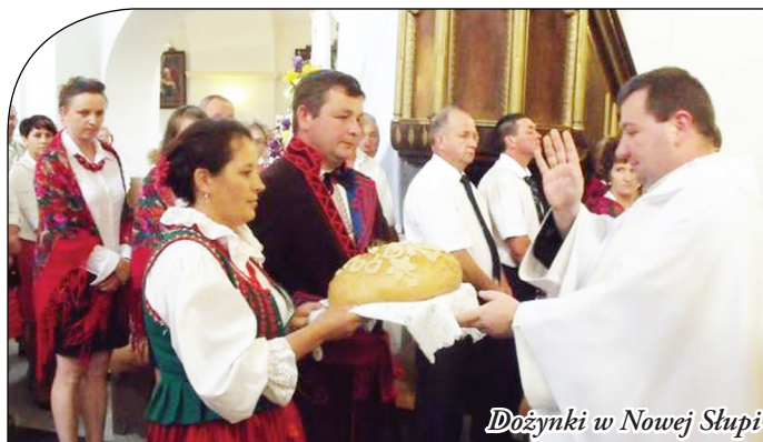
Dożynki w Nowej Słupi

Dobrą zabawę gwarantowały występy artystów oraz przygotowane różne gry i konkursy. Nie zabrakło również lokalnych smakołyków przygotowanych przez Koło Gospodyń Wiejskich „Chelmowianki” z Serwisa, KGW „Modrzewianki, KGW z Mirocic oraz radę Sołecką z Jeleniowa. Mogli je kosztować wszyscy uczestnicy dożynek.